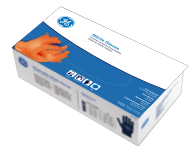
Caja de 50 Piezas