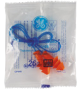
Bolsa de Poliuretano