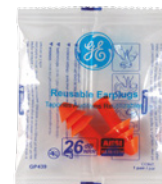
Bolsa de Poliuretano