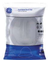
Bolsa de Poliuretano