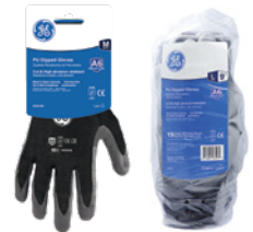
Tarjeta Colgante 12-Pack